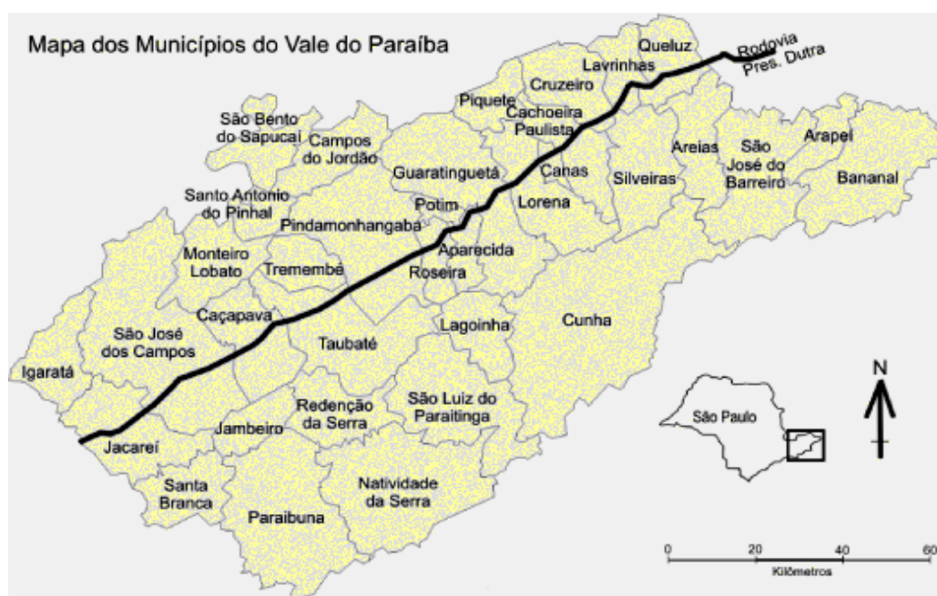
Figura 1 - Municípios do Vale do Paraíba paulista, com a via Dutra em destaque.

O Vale estende-se do território paulista até o estado do Rio de Janeiro . Situado entre as duas maiores cidades do Brasil , possui um parque industrial altamente desenvolvido, destacando-se em vários setores. Guaratinguetá é uma das cidades mais importantes.