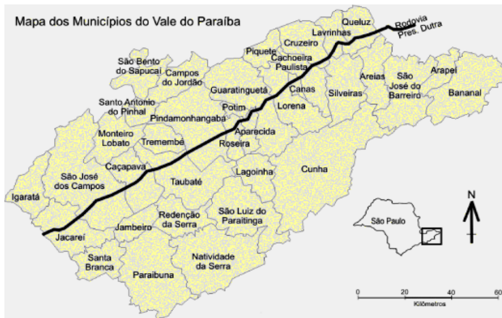
Figura 1 - Municípios do Vale do Paraíba paulista, com a via Dutra em destaque.

É necessário conhecer a história de Guaratinguetá para compreender a importância da Faculdade de Educação de Guaratinguetá na região do Vale do Paraíba e demais localidades do entorno.